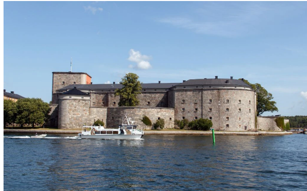
Festung von Vaxholm